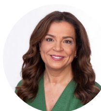
Luísa Salgueiro Presidente da Associação Nacional de Municípios Portugueses