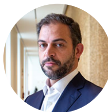
Duarte Cordeiro Ministro do Ambiente e da Ação Climática